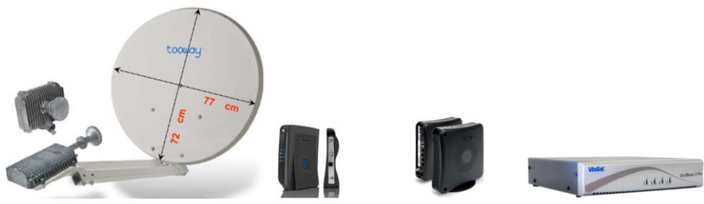
Anténa s integrovaným přijímačem/vysílačem Modem SB2 až 22/6 Mbit/s Modem SB2+ s Wifi až 50/10 Mbit/s Modem Advanced (Pro) až 50/10 Mbit/s a až 4 IP adresy

Stav terminálu lze kontrolovat na modemu http://192.168.100.1/ Satelitní parametry a spotřebu dat lze kontrolovat přes svůj terminál na http://checkportal.skylogic.com/